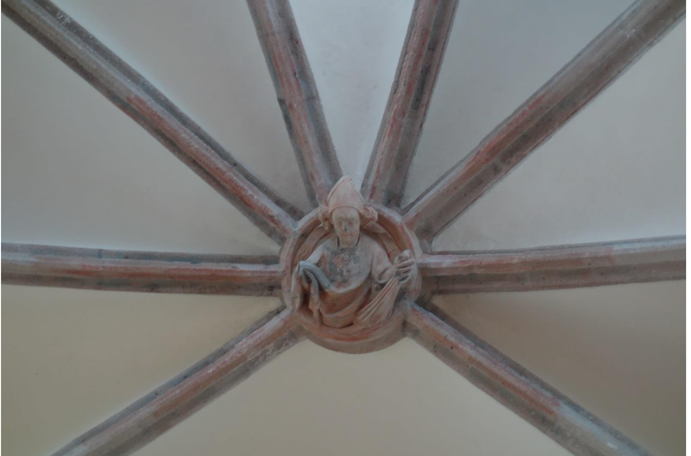
Sluitsteen met een afbeelding van St. Liudger.

Aan de oevers van de Vecht ontstonden in de vroege Middeleeuwen enkele nederzettingen. De nederzetting Loenen blijkt al in de tiende eeuw te bestaan. De oudst bekende vermelding van het dorp komt voor in een oorkonde van het jaar 953. Hierin schenkt Keizer Otto I (936-973) de goederen van graaf Hatto (overleden voor 953) in Lona (= Loenen) aan bisschop Balderik te Utrecht. Loenen moet dus al eerder zijn ontstaan. De kerk in Loenen is in de tiende eeuw gesticht als dochterkerk van de kerk in Nederhorst den Berg en gewijd aan Sint Liudger. In die tijd zal er ook wel een houten kapel zijn gebouwd. De oorspronkelijke kapel heeft op de plaats van het huidige koor gestaan. Als herinnering aan de ontstaansgeschiedenis is in het gewelf van het koor een sluitsteen met een afbeelding van Liudger ingemetseld. De grote Kerk van Loenen wordt ook wel Ludgeruskerk genoemd.