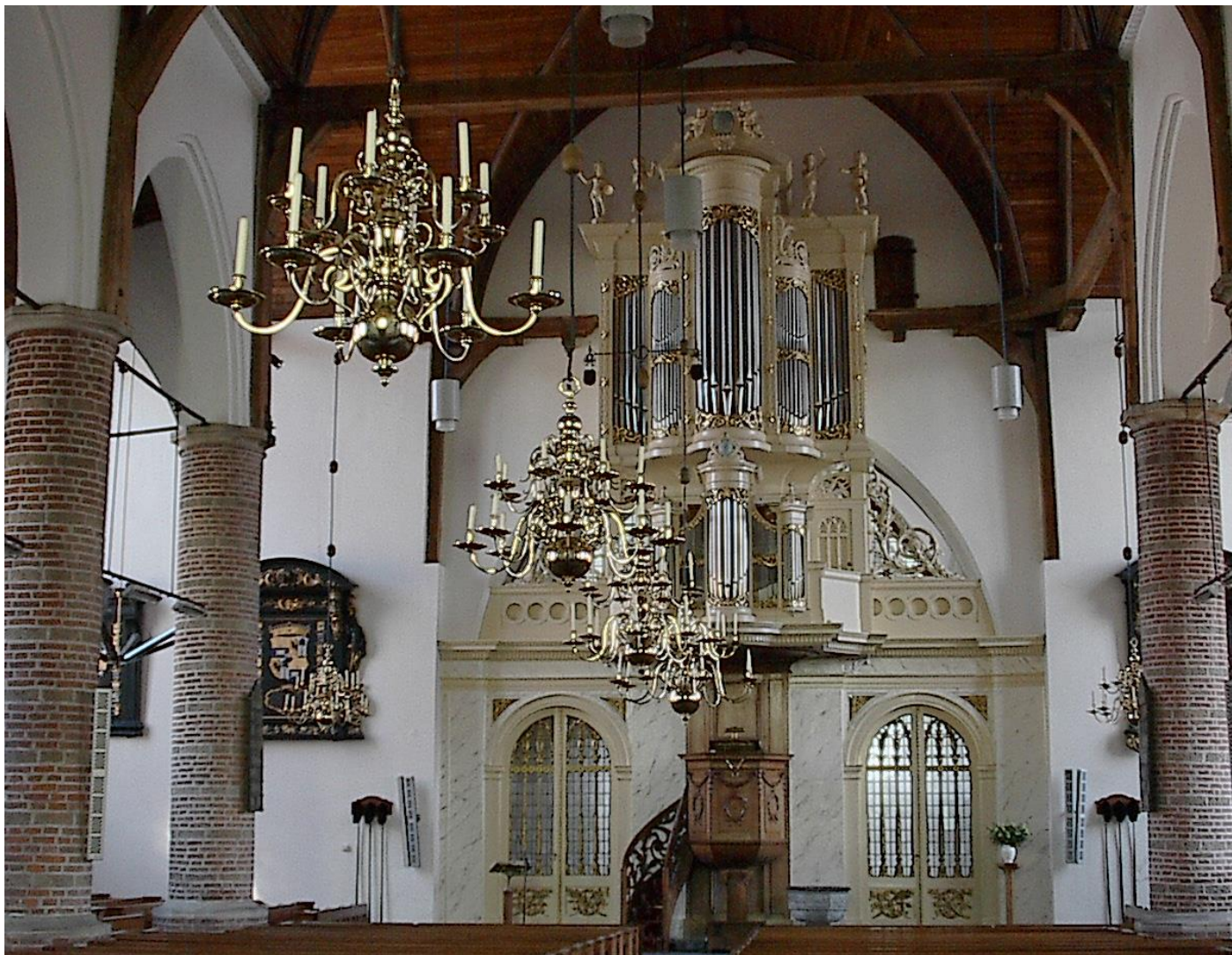
Het Flentrop orgel, in de triomfboog, na de grote onderhoudsbeurt in 2005.